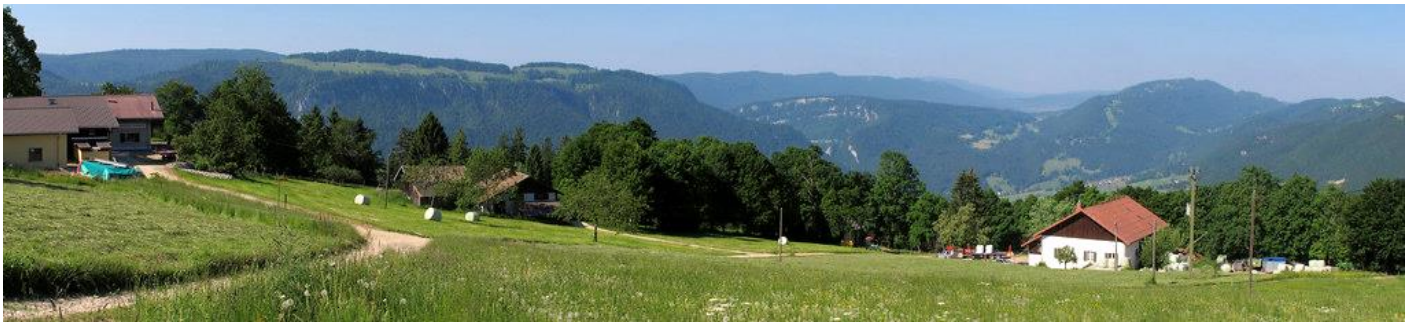
Mont Raimeux – der höchste Berg des Kantons Jura