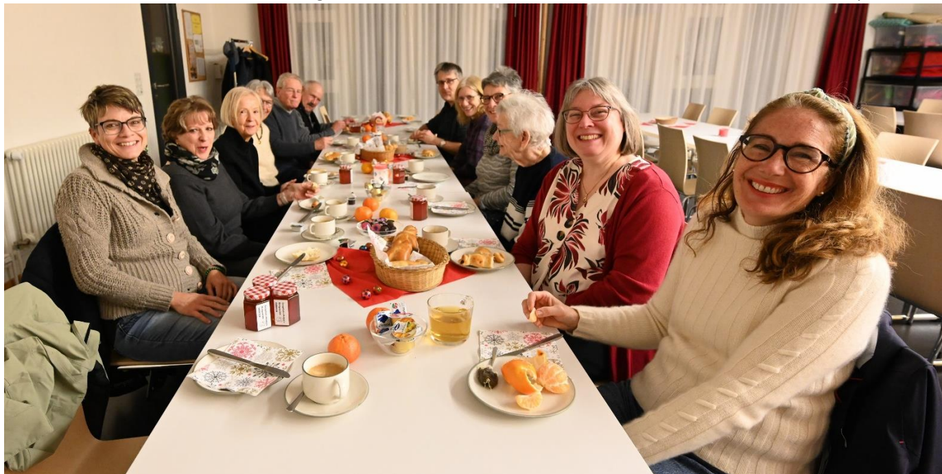
Foto: Am Frühstückstisch nach dem Rorate-Früh-Gottesdienst in der reformierten Kirche Thierstein am 26.11.25

Am frühen Morgen vom 26. November fand in unserer Kirche der erste von vier Rorategottesdiensten statt, die jeweils während des Advents in ökumenischer Zusammenarbeit mit der katholischen Kirchgemeinde Breitenbach-Fehren initiiert werden. Thema war das Flüchten vor Festtagen wie es dies z.B. gibt bei den «Weihnachtsmuffeln». Gerade recht kam da eine Weihnachtsgeschichte zu «Post aus Barcelona» von Pedro Lenz und Reto Stampfli.