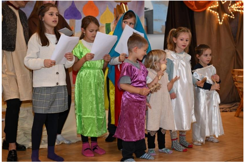
Foto: Krippenspielaufführung im Alterszentrum Bodenacker in Breitenbach

Unsere Sonntagsschule übte und probte mit Kindern und Jugendlichen von Oktober bis Dezember das Krippenspiel: «Das Mädchen mit den Schwefelhölzern findet seine Wärme»: dies in Anlehnung an das bekannte und tragisch endende Märchen von Hans Christian Andersen. In unserem Krippenspiel kam es jedoch für das Mädchen mit den Schwefelhölzern zu einem «Happyend» bzw. zu einer «Happy night» oder passender zu einem «Happyday». Elf Jungen und Mädchen im Alter von 3 bis 15 Jahren spielten mit und «verzauberten» ihr Publikum am 17. Dezember im Alterszentrum Bodenacker und am 24. Dezember in der Kirche anlässlich des Heilig-Abend-Gottesdienstes.