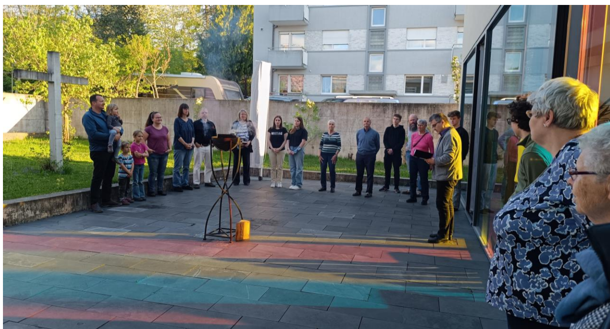
Abendimpression von der Ostervorabendfeier am Karsamtag