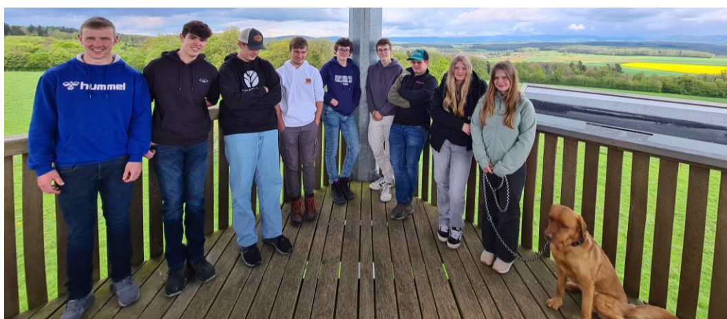
Konfirmandenlager- Gruppenfoto auf dem Renaudturm bei Boncourt JU

Am Samstagmorgen gab es noch eine «Lädele»-Tour durchs St. Ursanner Altstädtchen und anschliessend eine «Escape Room»-Aktion im Ortsbahnhof. Gegen Mittag fuhren wir noch zum Étang de la Gruère hoch in die Freiberge mit Lunch und Seemrundung und schliesslich gings wieder zurück nach Breitenbach.