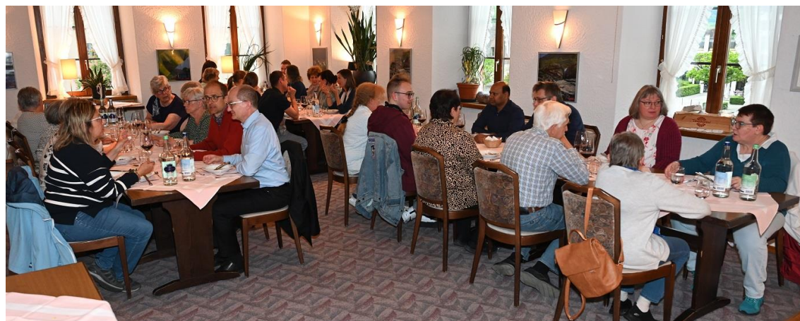
Die ersten Minuten beim Mitarbeiter- und Freiwilligenhelferessen