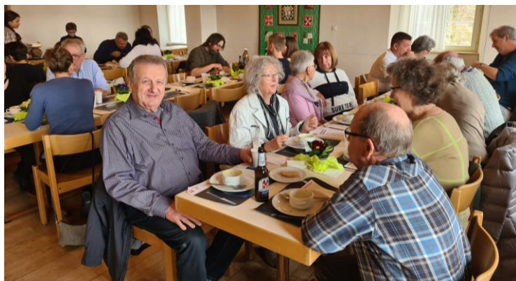
Foto vom Suppentag in Himmelried am So. 23. März 2025

Am den Fastensonntagen: 23. März (Himmelried), 30. März (Bärschwil) und 6. April (Beinwil und Breitenbach) gab es in unserer Umgebung mehrere Suppentage mit ökumenischen Gottesdiensten. Diese waren einerseits dem neuen Hungertuch gewidmet, andererseits auch dem Motto: «Hunger frisst Zukunft». Mit viel Freude und Können wurden die Suppengerichte und feinen Kuchendesserts von den Ortskirchgemeinden vorbereitet. In angeregten Diskussionen sass man zu Tisch: Reformierte und Katholiken, und genoss dabei die gute Stimmung, und von draussen her auch das schöne Wetter. Die Tisch-Kässeli für den guten Zweck wurden eiligst gefüllt und die eingegangenen Geldbeträge später an die Fastenaktion und HEKS Brot für alle-Projekte weitergeleitet. Aktuell sind ja sehr viele Hilfswerke auf dieser Welt auf genügend Spenden angewiesen. Sie wollen ihre Projekte umsetzen zu können, auch wenn Trumps Amerika vielen NGOs den Geldhahn abstellt bzw. schon zugedreht hat.