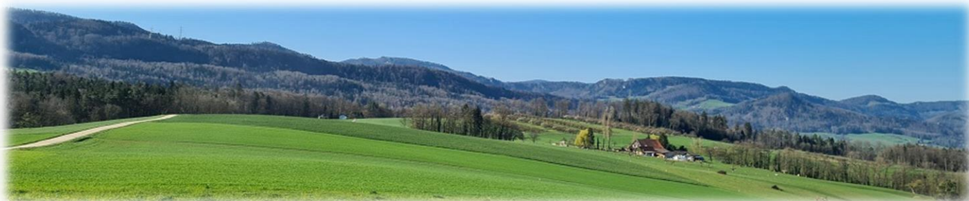
Wanderaussicht am 25. Mai

Sonntag, 25. Mai , 10 Uhr, Treffpunkt: Spielplatz Hirzenwald oberhalb von Breitenbach zum: «Grüess-Gott-Spaziergang»: Zeitumfang ca. 1-1½ Stunde mit Haltepunkten: Moosgräben (508m), Dürrbachübergang (491m), Weggabelung zum Littstel, Hütten-Rastplatz (571m) zwischen Helgenmatt und Littstelchöpfli. 12 Uhr: Musik und anschl. Bräteln. Ausklang um 14 Uhr. Mitnehmen: eigenes Grillgut oder Vegi-Salate! Kuchen und Kaffee wird vom Org.-Team gestellt